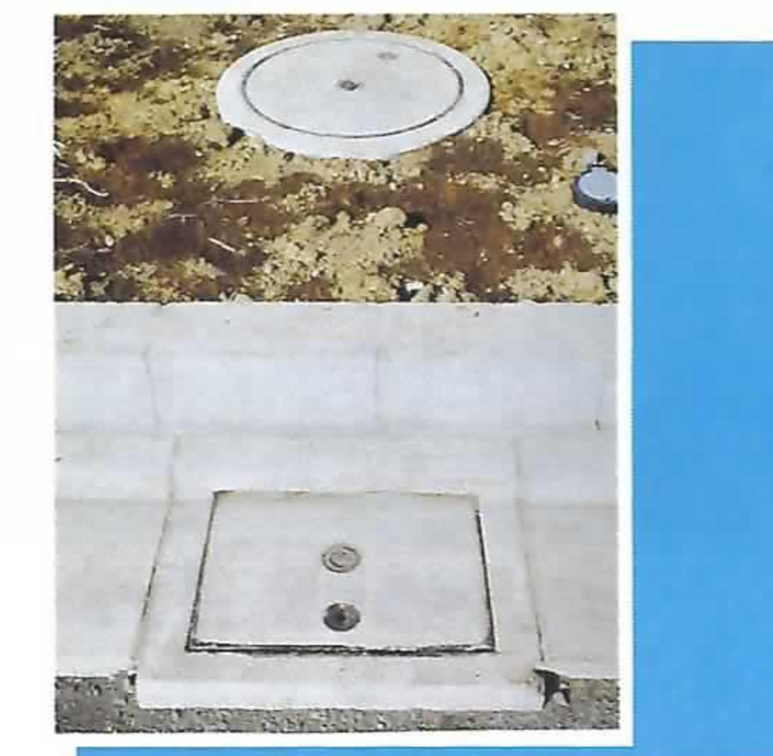
宅内柵と公共汚水柵