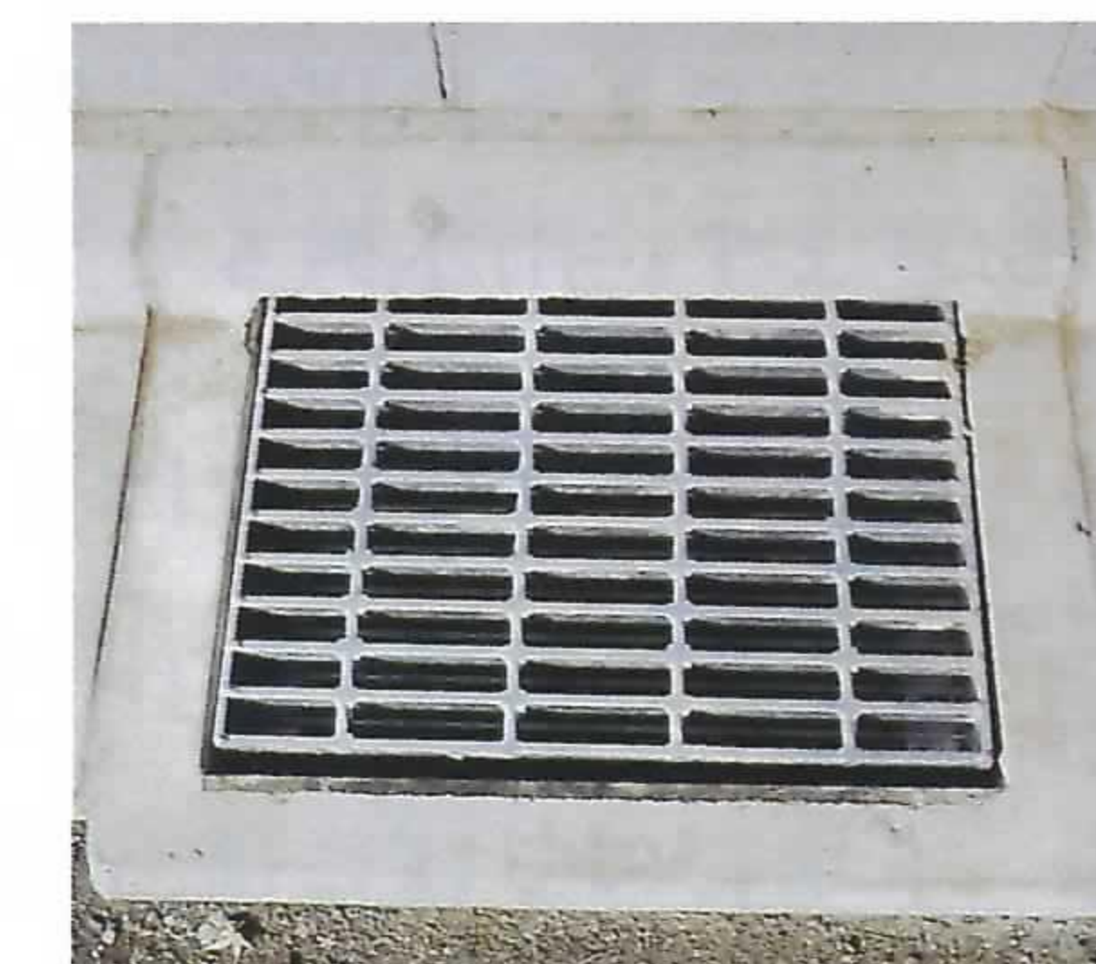
角型(グレーチング・L型用)

⑦排水設備 …… 宅内から汚水や雨水を排除し公共下水道に接続するまでの設備を言い下記のような種類があります。