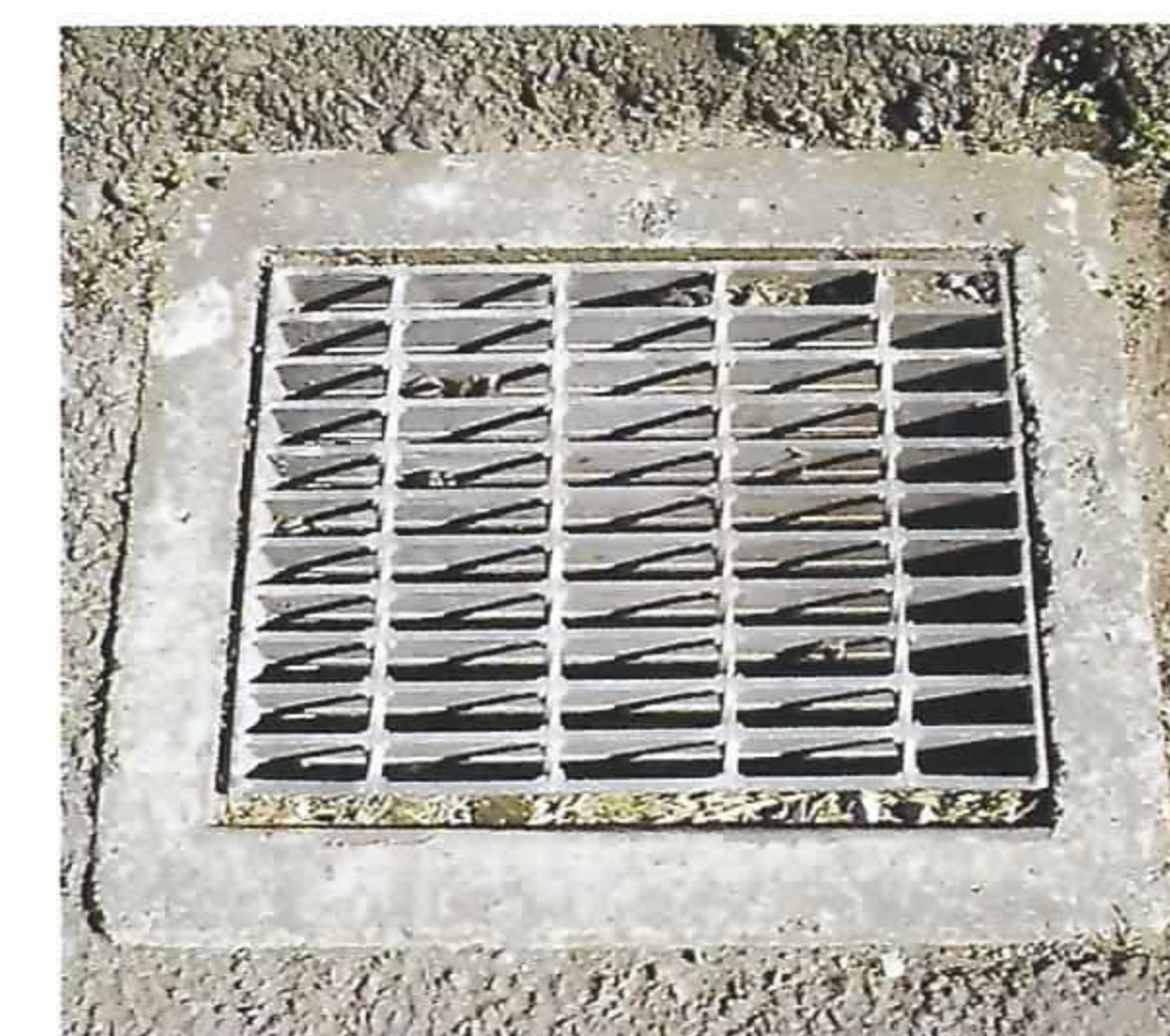
角型(グレーチング)