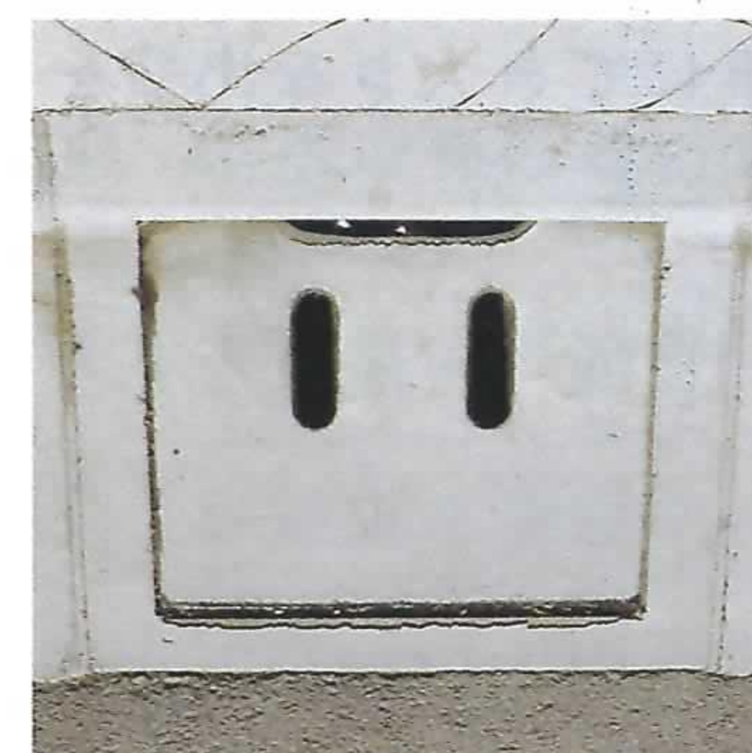
角型(コンクリート蓋)

⑥公共雨水柵 …… 道路上の雨水を排除するもので、道路の宅地寄りに設置されています。