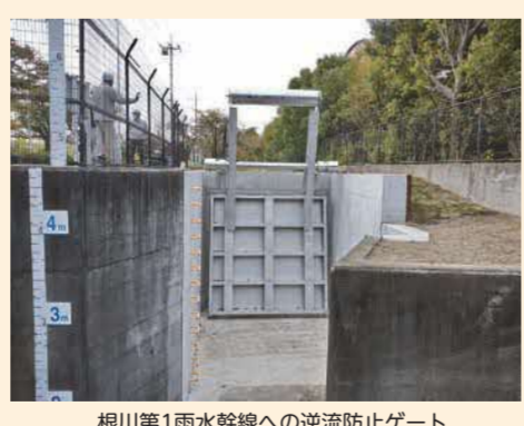
根川第1雨水幹線への逆流防止ゲート