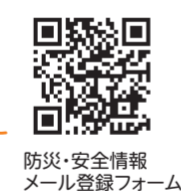
防災・安全情報メール登録フォーム

登録方法/登録用メールアドレス(c-bousai@sg-m.jp)に空メールを送信後に、自動受信されるメールから、またはQRコードからアクセスしてご登録ください。