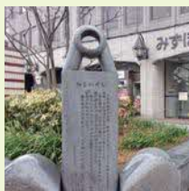
港区表参道大元電付近にある山の手空襲犠牲者の慰霊碑

申込 往復はがきまたはEメールに、参加希望日(①か②、あるいは両日)、参加者の住所、氏名、年齢(学年)、電話番号を明記し、7月20日(木)(必着)までに北部公民館☎488-2698・E:hokubuk@city.chofu.lg.jp