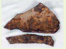
佐須地域に落下した爆弾の破片