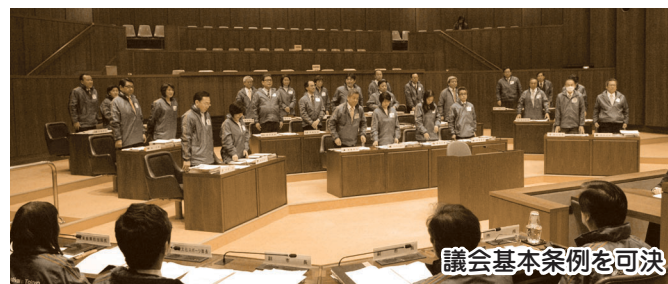
議会基本条例を可決