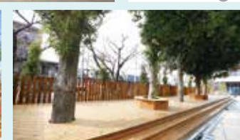
旧クリーンセンター時代からこの場所を守っている白樺の木