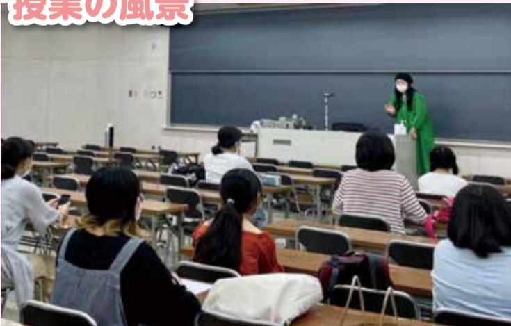
▶ 白百合女子大学キャンパス