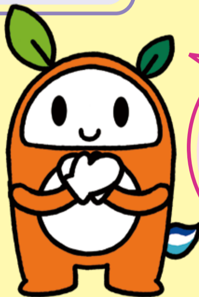
調布市ごみ減量・リサイクルキャラクター リサッチョ