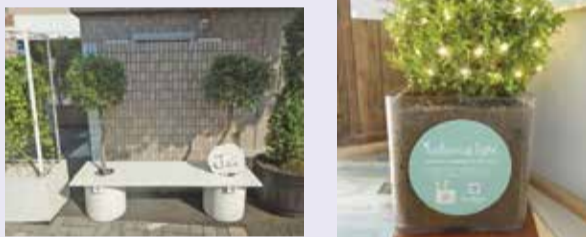
再生プラスチックを用いた「ベンチプランター」と「ボタニカルライト」(調布駅前広場に設置)

地球温暖化をはじめとする環境問題について、環境・緑の保全やリサイクルの推進など、調布市と連携して取り組んでいます。