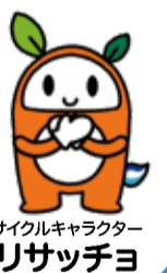
調布市ごみ減量・リサイクルキャラクター リサッチョ

令和5年1～3月分の目標は達成しましたが、年度目標は達成できませんでした。より一層のごみ減量へのご協力をお願いします。