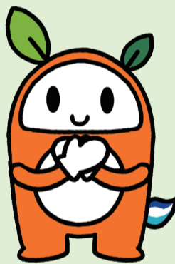
調布市ごみ減量・リサイクルキャラクター リサッチョ