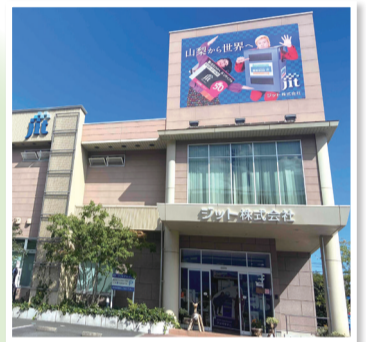
ジット株式会社 (山梨県南アルプス市)

市の拠点で回収された使用済みインクカートリッジは、「インクカートリッジ再生事業」を実施しているジット株式会社へと渡し、環境配慮型製品として再利用されています。