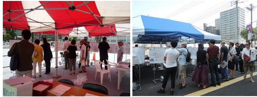
▲ オープンハウス当日の様子

令和元年7・8月に、調布駅前広場を訪れている方々を対象に、調布駅前広場計画の今までの経緯や検討内容等についてご説明し、皆様から広くご意見をお聞きすることを目的として、オープンハウスを計4日間開催しました。