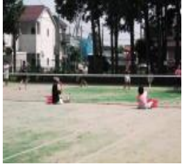
女子ソフトテニス