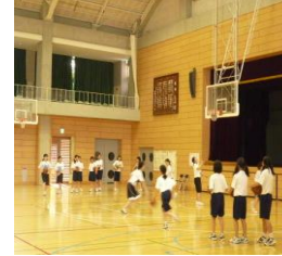
女子バスケットボール