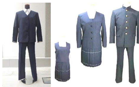
女子用スラックス