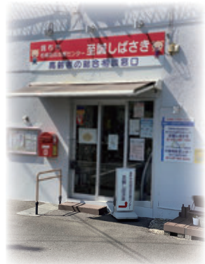
< 地域包括支援センター >

高齢者が住み慣れた地域で安心して暮らし続けられるよう、地域包括ケアを推進する中核機関として、地域との連携の強化を図るとともに、福祉圏域の特徴に応じた地域包括支援センターの体制整備を推進します。また、認知症地域支援推進員を継続配置し、在宅医療・介護連携推進や認知症対策の実施に取り組みます。