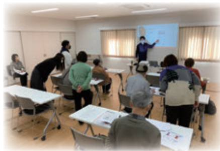
<シニア向けスマートフォン講座>

高齢者のデジタルデバインド解消に取り組むとともに、フレイル予防事業の実施、多世代交流の場につながる常設通いの場の整備を推進します。また、高齢者の健康寿命の延伸を目指した産学官連携での取組を進めます。その他、要支援・要介護状態になるのを防ぐための介護予防事業の実施や、要支援者に対する介護予防・日常生活支援総合事業によるサービス提供を推進します。