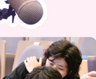
▲監督からカメラワークのアドバイス