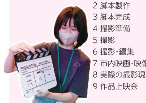
▲みんなでアイデアを出し合いながら脚本作り