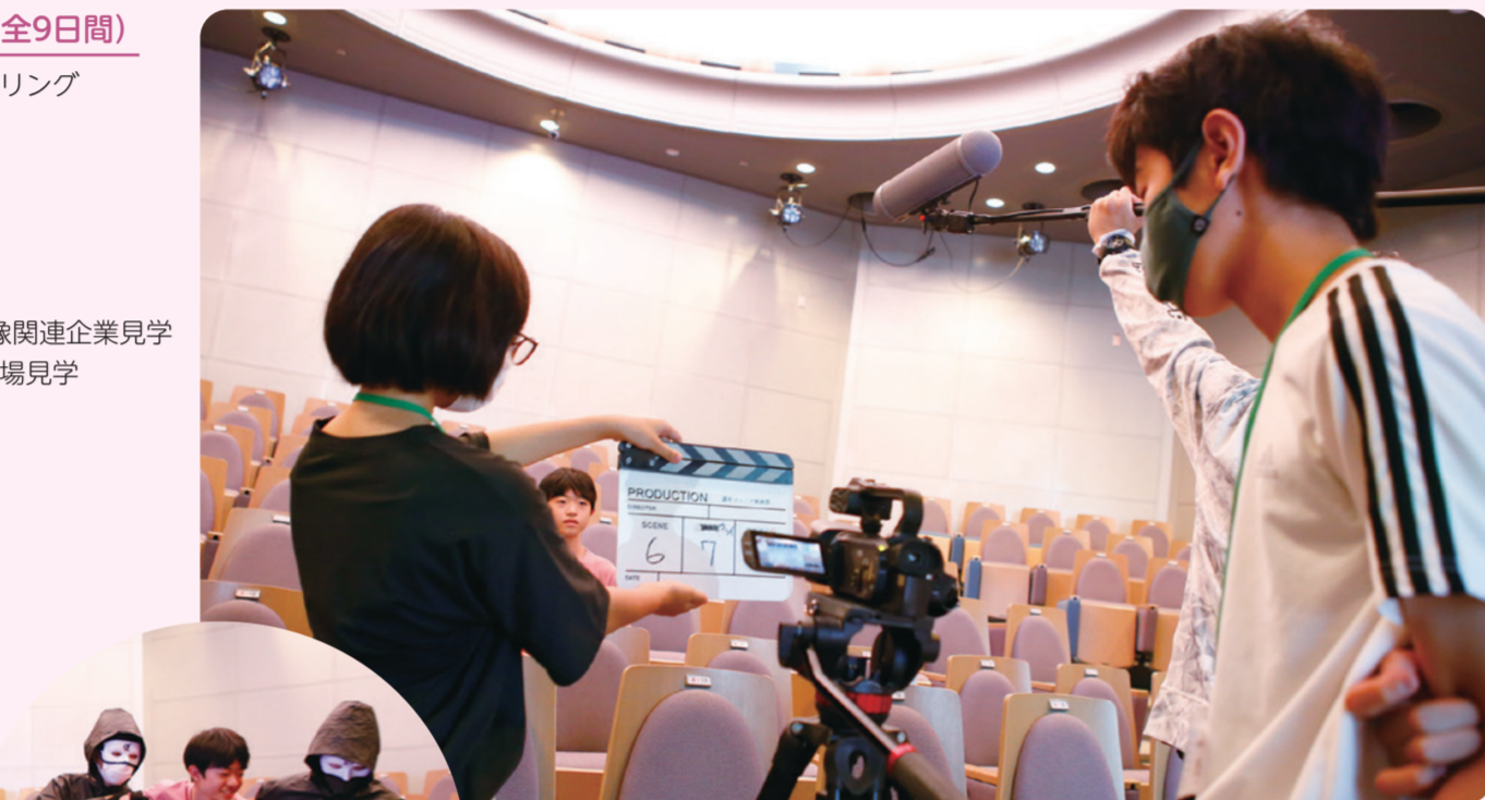
▲同じストーリーを出演者を変えて撮影