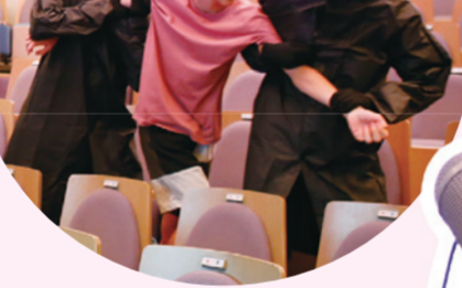
▲撮影だけでなく演技も