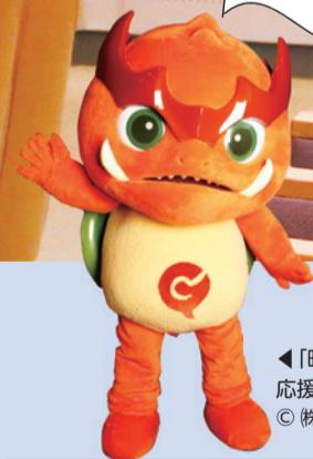
◀「映画のまち調布」 応援キャラクター ガチョラ © 株式会社大映スタジオ

プロの映画監督や技術者が教える、中学生のための映画作りワークショップ「調布ジュニア映画塾」と、高校生を対象とした「高校生フィルムコンテストin映画のまち調布」など、将来の映画人を育成・輩出することを目的とした「映画のまち調布」の取り組みを紹介します。