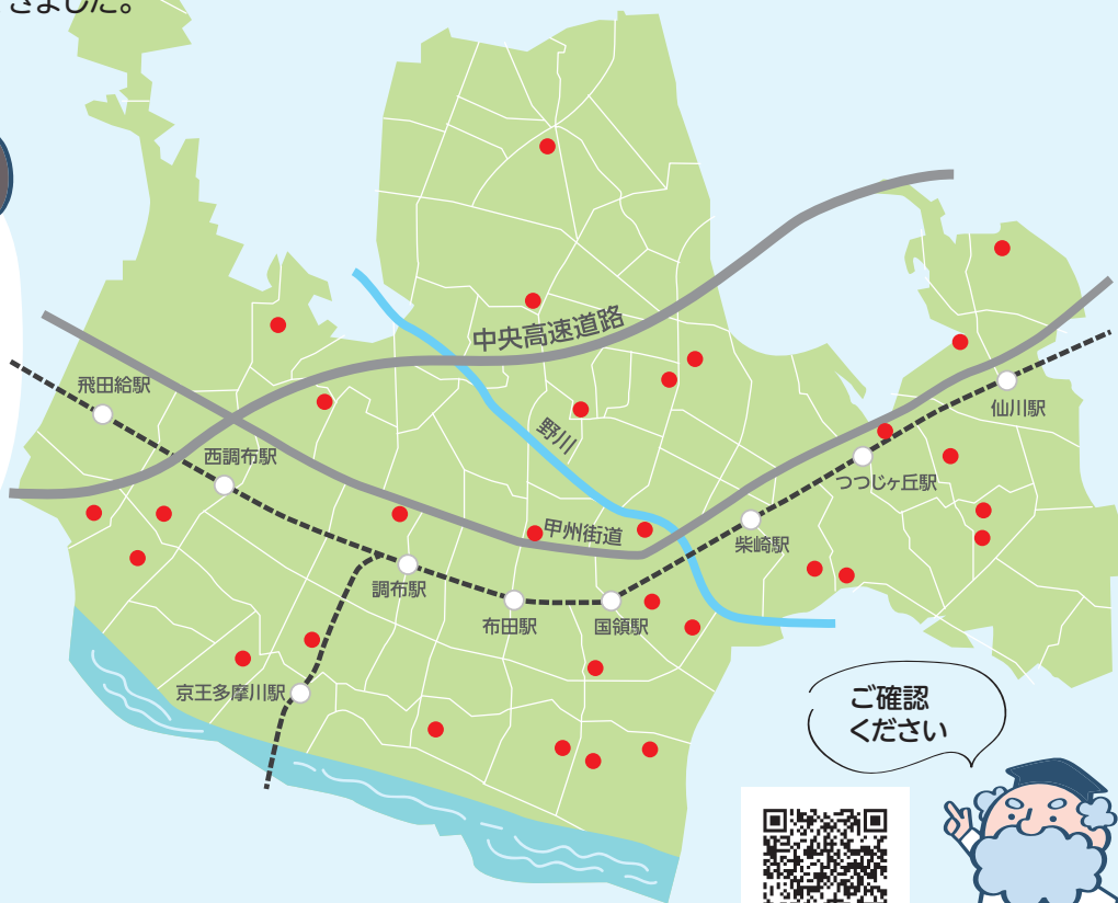
井戸等所在位置図(調布市管理井戸30カ所)