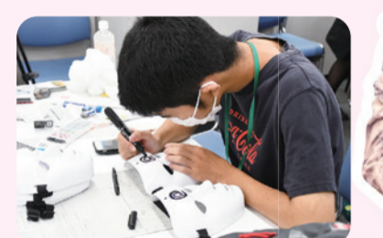
▲小道具も全て手作り