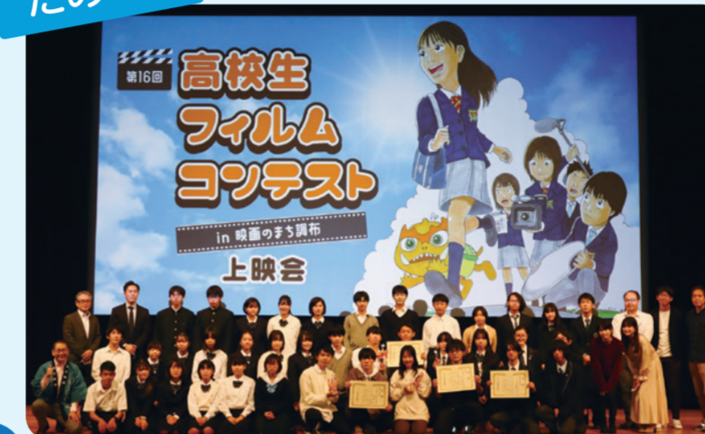
第16回高校生フィルムコンテスト in 映画のまち調布

高校生が自主製作し、1次審査を通過した映画・映像作品から最優秀作品賞などを決定します。プロの映画・映像関係者が審査をすることで、「映画のまち調布」から将来の映画人を育成・輩出することを目的としています。