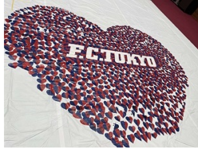
「第15回 味の素スタジアム感謝デー」 令和5年6月17日(土曜日)