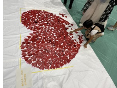
「第2回車いすバスケットボールChofuエキシビジョンマッチinむさブラ2023」 令和5年6月18日(日曜日)