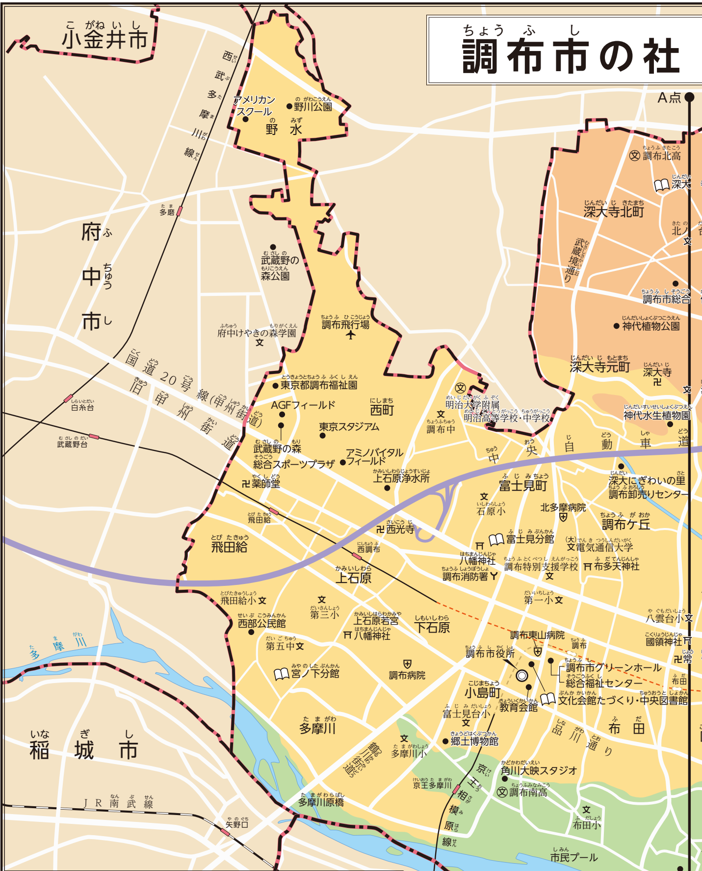
調布市の土地のようす