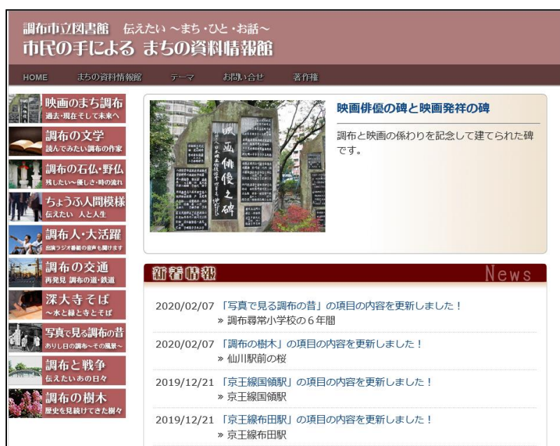
「市民の手によるまちの資料情報館」トップページ

と戦争」「調布の樹木」について公開・調査しています。令和4年度は、活動を休止したため新たに公開した項目はありませんでした。