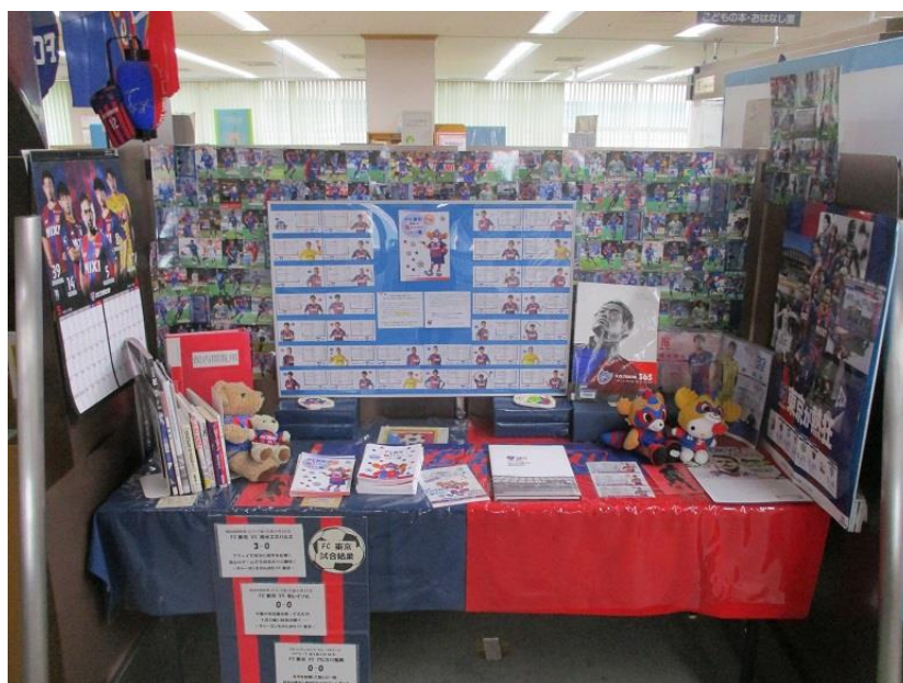
中央図書館FC東京応援展示コーナー

令和4年9月1日（木）に開催されたFC東京情報交換会（主管課スポーツ振興課）に出席し、冊子の作成・配布状況などについて情報提供を行いました。また、令和5年3月15日（水）に開催されたFC東京情報交換会は資料提供のみでした。