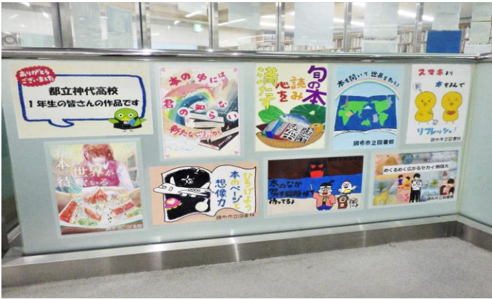
展示の様子（中央図書館）