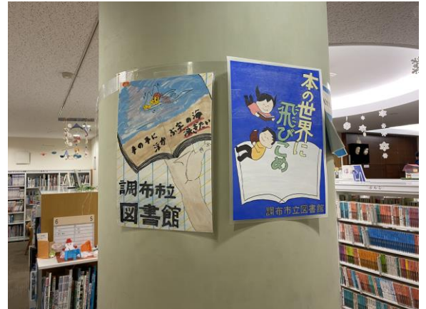
展示の様子（深大寺分館）