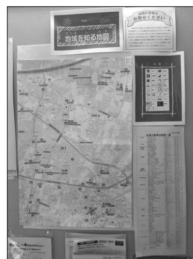
「地域を知る地図」(佐須分館)

地図に載せられない情報は「周辺施設一覧表」にまとめ、施設のリーフレットやパンフレットとともに「まちの施設ガイド」にファイルしています。