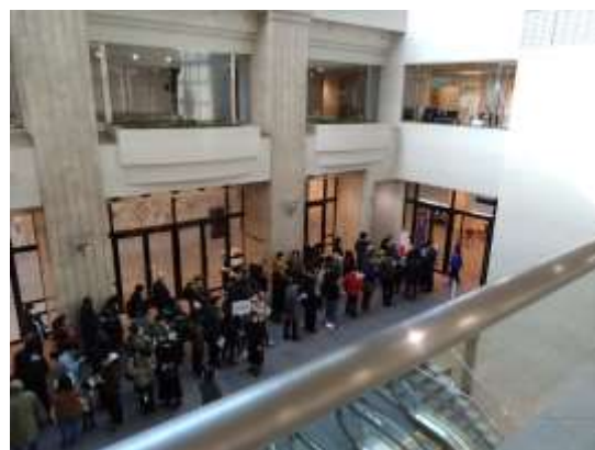
1/21（土）、22（日）は入場規制を実施