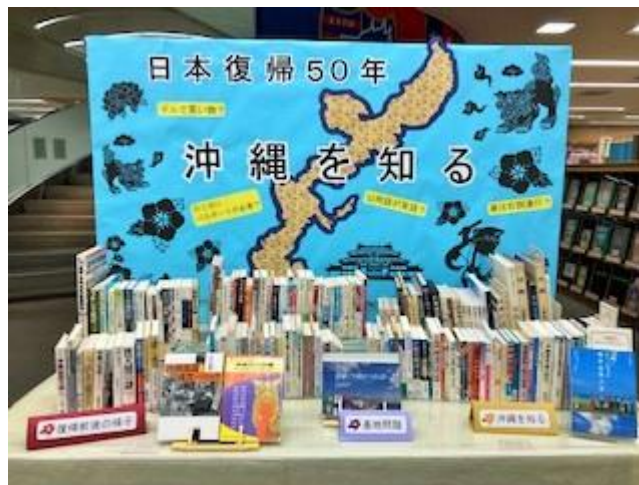
中央図書館4階正面展示