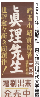
1951年 実篤著「真理先生」増刷ボスター 調和社 増刷ボスター 増刷出来 発売中