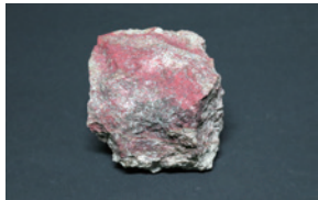
辰砂(採集地:北海道)

往復はがき(1枚1組)に、参加者全員の住所、氏名(ふりがな)、年齢、電話番号を明記し、12月8日(金)必着までに郷土博物館へ。締切後、定員に満たない場合は、12月12日(火)午前9時から電話で受け付け(先着順)