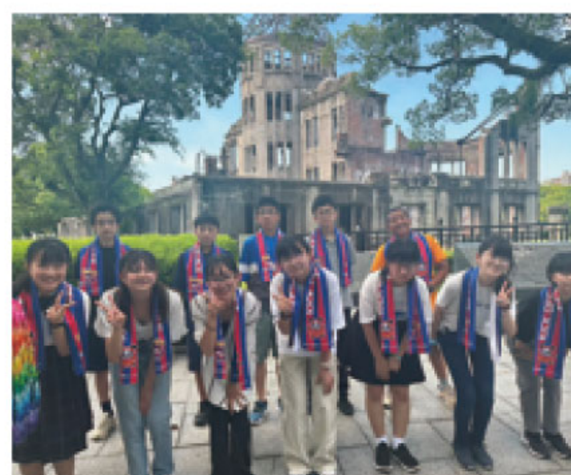
ピースメッセンジャー2023

※本事業には、FC東京及び(株)渋谷不動産エージェントに御協力いただいています。