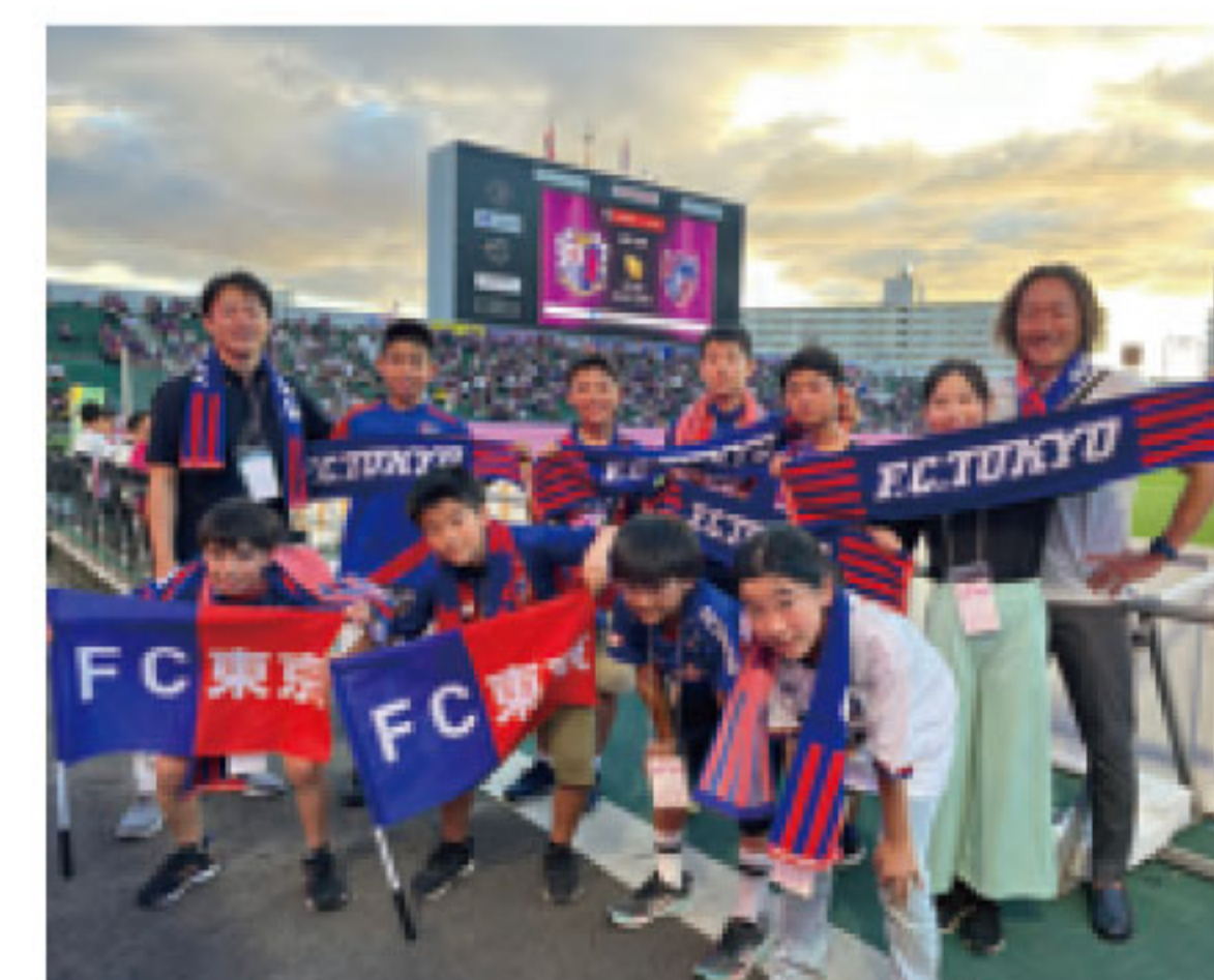
ピースメッセンジャージュニア2023