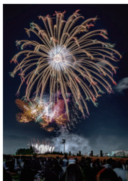
第9回調布花火フォトコンテスト 最優秀賞「散華」