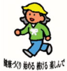
健康づくり始める会