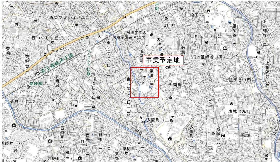
図1 事業予定地位置図