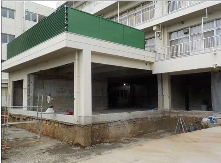
No.5 調布市立石原小学校給食室改修工事 内部 解体状況