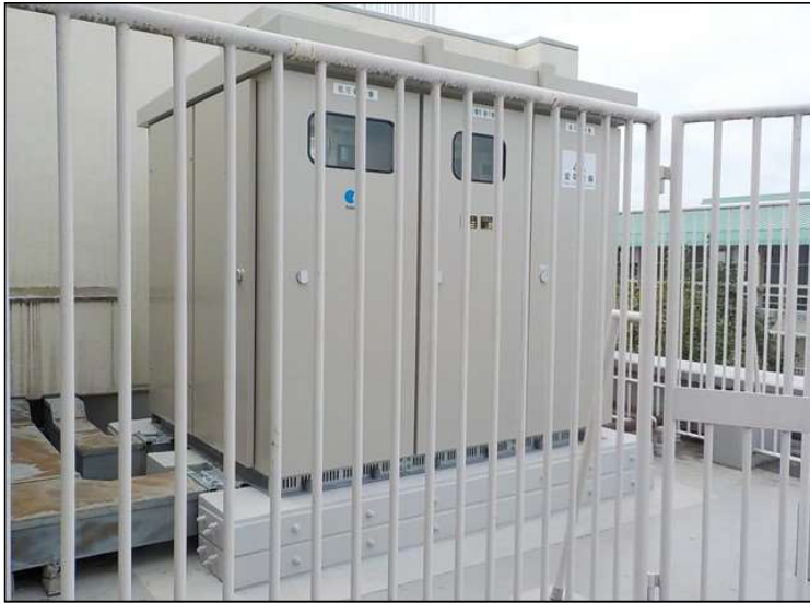
No.1 調布市立石原小学校受変電設備改修工事 受変電設備 設置状況