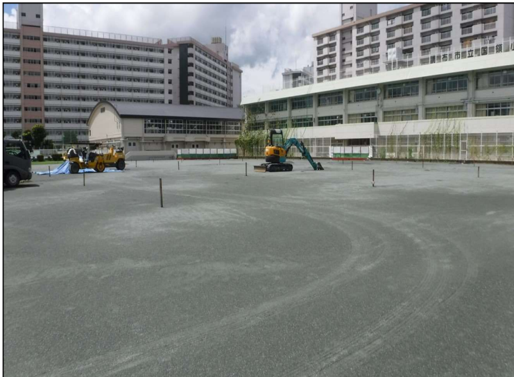
No.2 調布市立国領小学校校庭整備工事 校庭 施工状況