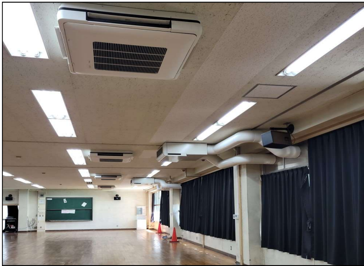
No.7 調布市立第五中学校多目的室空調整備工事 空調機設置 完了状況