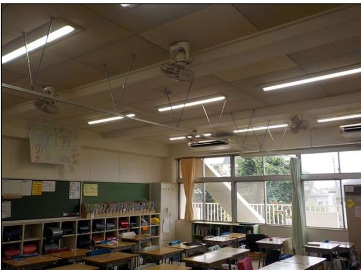
No.3 調布市立第二小学校校舎LED化改修工事 LED照明 設置状況