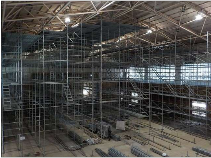
No.4 調布市立第三中学校第一体育館改修工事 体育館内部 施工状況