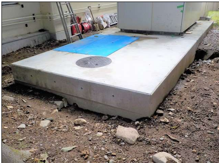
No.8 調布市八ヶ岳少年自然の家受変電設備改修工事 基礎工事 施工状況