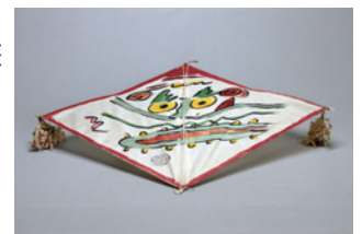
孫次 麻 龍