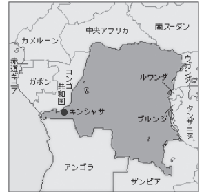
▲コンゴ民主共和国

コンゴ民主共和国(以下、コンゴ)で起きている「紛争鉱物問題」は、スマホなど私たちの身近な電子機器の原料である鉱物が紛争の資金源になっている問題と、それにとまなう紛争下の性暴力問題まで、「遠い国の問題」として看過できない深刻な問題になっています。そこで、コンゴの紛争鉱物問題を研究する講師からお話をお聞きし、私たち日本の市民に何ができるのかを考えてみませんか。