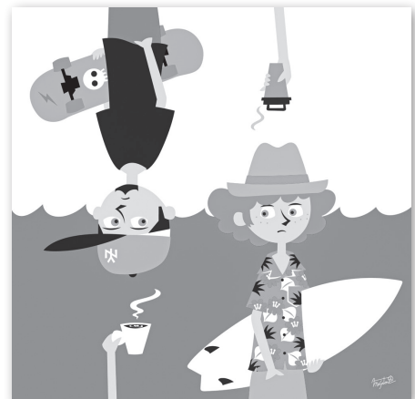
▲ sea and street