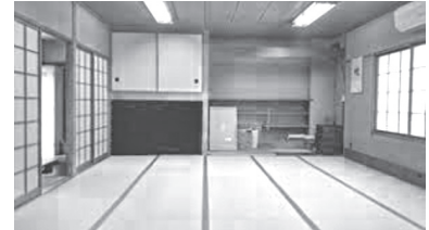
▲東部公民館和室(小)