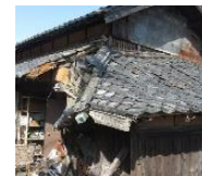
緊急代執行を要する崩落しかけた屋根