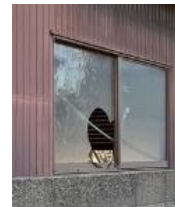
窓が割れた管理不全空家