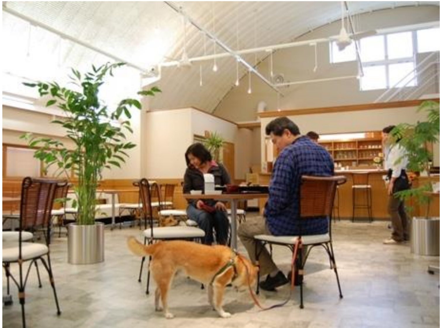
カフェ・イベント空間（ドッグカフェ）