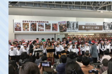
クリスマスコンサート(飛田給)