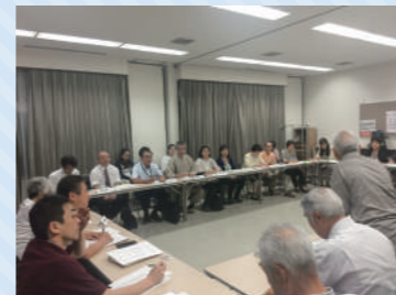
地域活動団体交流会(石原)

情報交換は、地区協議会のメンバーが定期的集まり、地域の情報共有や課題についての意見交換等を行うなど、地域のネットワーク組織である地区協議会の根幹となる活動です。定例会の他にさらに多くの地域の方に声掛けをした交流会を年数回程度開催している地区もあります。