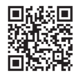
地域コミュニティサイト「ちょみっと」へ