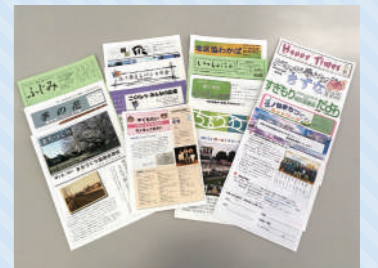
地区協議会の広報紙

地区協議会が発行している広報紙は、地域ごとに配布しているほか、市ホームページ、市役所8階の協働推進課窓口等でも閲覧することができます。