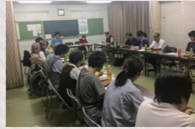
運営委員会の様子

活動内容は地区により様々ですが、防災や防犯など地域課題の中で一つの団体では対応が困難なことや、地域で協力して取り組む方が効果的・効率的なことに対して、地域の皆さんで考えながら取り組んでいます。