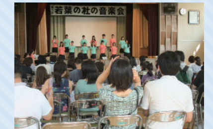
若葉の社の音楽会(若葉)