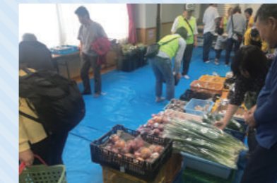
ふれあい朝市(北ノ台)