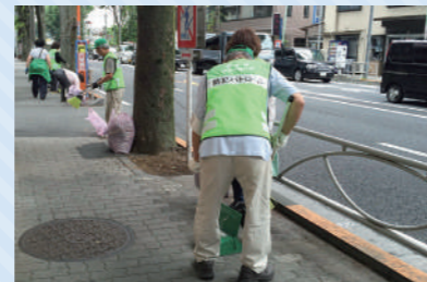
530(ごみゼロ)運動(滝坂)