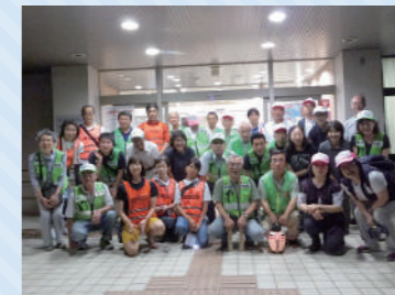
合同防犯パトロール(布田・富士見台・多摩川)

小学校を会場とした大規模な防災訓練や防災の取組等が行われています。毎回、地区協議会の皆さんで内容を検討し、工夫した訓練が実施されています。また、夜間パトロールや子どもの見守り活動など、防犯に関する活動を行っている地区もあります。