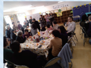
ボランティア交流会(上ノ原)