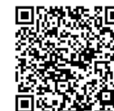
市民活動支援センターホームページ