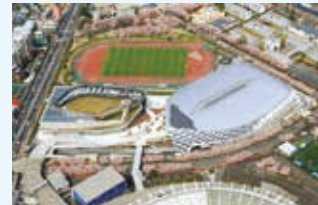
武蔵野の森総合スポーツプラザ

味の素スタジアムに隣接する場所に東京都が整備した、大規模なスポーツ大会やイベント興行が開催可能な総合スポーツ施設です。 メインアリーナのほかにサブアリーナ、プール、トレーニングルームなどを併設しています。 また、2020年の東京オリンピック・パラリンピック競技大会の開催が予定されています。