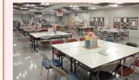
活動スペース「みんなの広場」