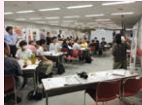
実行委員会の様子

今年度も、市民プラザあくろす2・3階、国領駅前広場を会場に下記日程での開催が決まりました。 現在、実行委員会で誰もが楽しめる企画を検討しています。是非皆様ご来場ください。