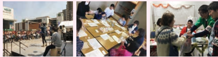
屋外ステージでの発表 仙川はちみつを使った石けんづくり ラリー企画

平成29年3月20日に第3回調布まち活フェスタを開催しました。当日は約2,100人の方が来場され、ステージ、ワークショップ、模擬店のほか、イベント全体を回るラリー企画など、盛りだくさんの企画を楽しまれました。 当日は、市民プラザあくろす2階の調布市市民活動支援センターのイベント「えんがわフェスタ」と同日開催で、お互いのイベントをまたがるコラボ企画もあり、会場全体で盛り上がりました。