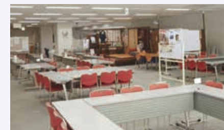
活動スペース「はばたき」