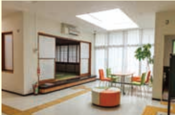
西部地域福祉センター