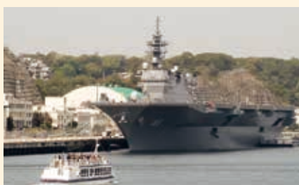
横須賀軍艦クルーズ