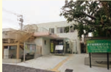
金子地域福祉センター

大規模改修を実施し、装いを新たにリニューアルオープンしました。内外装や空調の更新、トイレのバリアフリー化に加え、ロビーにくつろぎスペースを設置しました。