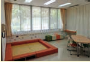
下石原地域福祉センター

今まで雑庫として使用していた部屋を整理し、乳幼児を連れた子育て世代の方が気軽に打合せなどを行える部屋として、テーブルと椅子のほか、サークルを配置し、お子さまの様子を見ながら、安心して地域活動などができるスペースとしました。