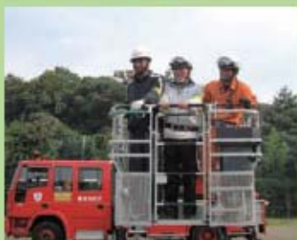
昨年の防災訓練の様子。

今年度は東日本大震災が起きたこともあり、そのような大災害も念頭に入れて活動していきたいと考えています。