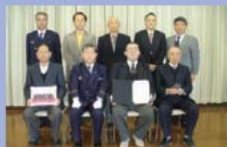
地域の防火防災功労賞を受賞しました。

自治会関係者が中心となって設立した当協議会を、第三小学校区の「地区協議会」として、地域住民の方々や既存の活動団体の方々に参画していただける組織を目指し、努力しています。