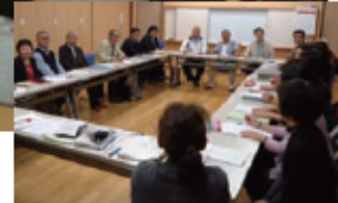
定期的に集まって、会合を開いています。