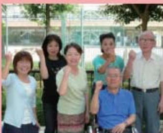
元氣いっぱい活動しています。