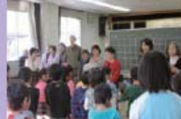
恒例の子どもおたのしみ会。

今年度は市長の提案でもある「地域カルテ」を活用し、緑ヶ丘西部地区の交通不便地域解消のために「乗合タクシー導入」を目指しています。