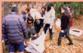
子どもたちとカブトムシをふ化させました。