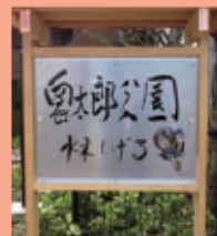
鬼太郎公園もあります。