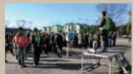
防災訓練、開地の挨拶(指示です)参加の皆さん神妙に聞き入っています!