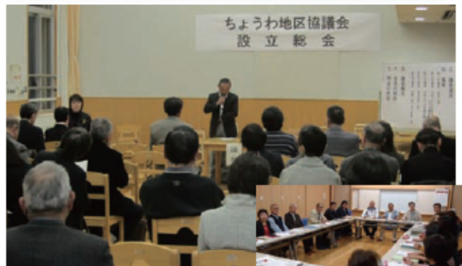
震災当日の設立総会にも、大勢の方が駆けつけました。

ちょうわ地区協議会では、地域と市が協働して公共サービスの一端を担う提供主体となり、身近な分野で共助の精神で活動する「新しい公共」を育てていくような血の通った組織づくりを目指して活動を展開していきます。