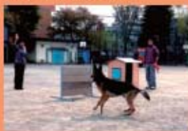
防災訓練では、災害救助犬も登場しました。

安全・安心、地域友好、「自分たちの地域は自分たちで守る」をモットーに設立しましたので、今後このモットーに沿って活動していきたいと思っています。