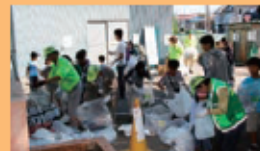
「美化大作戦」で自分たちのまちをきれいにしました。

今年度は東日本大震災を教訓に、昨年実施した「イザ! カエルキャラバン」を上ノ原地域に合った形で実施したいと計画を進めています。