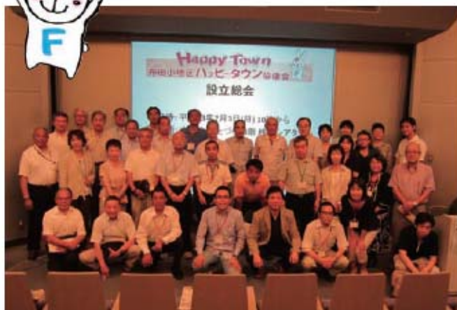
文化会館たづくりでの設立総会の様子です。