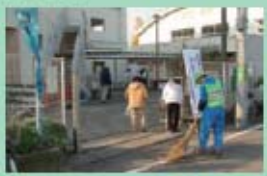
ふれあいクリーンデーで地域をきれいに。

自治会や健全育成など、それぞれの団体が能力を持ち、素晴らしい活動を行っており、地区協議会がそのつなぎ役としてよりよい地域をつくるお手伝いができればと思います。