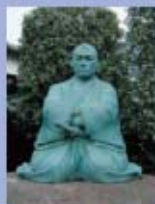
西光寺の近藤勇像。