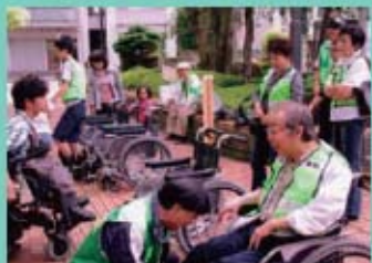
昨年は、市役所前庭で防災訓練を行いました。