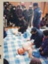
防災訓練にて、「人工呼吸」と「AED」の訓練です。

これからも地域の「安全・安心」をテーマに活動をしていきますので、ご協力をお願いいたします。