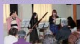
文化交流会では、近畿大学の学生さんが演奏してくれました。

唯一残念だったのは、4月初めの当会議最大のイベントである「桜まつり」が東日本大震災の影響で中止せざるを得なかったことです。