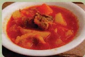
「アゼリ風トマト肉じゃが」(アゼリ民族の料理 ※写真)

日本でも難民の方が生活しています。彼らの日本での生活は日本人とは比べものにならないほど過酷。そんな社会を「変えていこう！」と難民の周知・理解を進めるために活動している若者たちがいます。