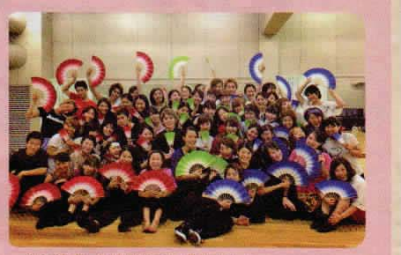
一緒に練習した仲間はとても仲良し☆

問合せ先: 桐朋学園芸術短期大学 演劇専攻研究室 Tel: 03-3300-3917