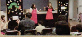
百合女子大学では「児童文化クラブ」も読み聞かせや人形劇で子どもたちを楽しませる活動をしています

することが何よりもやりがい。最近では、調布市内の書店からも声がかかり、活動の場が広がりました。