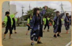
地域運動会での発表に緊張気味のみんも、イベントが終わると充実した笑顔でいっぱいでした♪

中学生が踊りを踊って、見ている人を楽しんでもらうことをボランティアと考え、活動しています。学校行事、地域のお祭りや高齢者施設などで発表しています。青少年赤十字の活動にも参加し、救急救命講習を受けたり、東日本大震災の慰霊祭のお手伝いなどもしました。