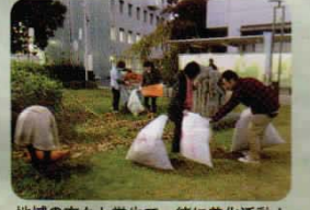
地域の方々や学生と一緒に美化活動!