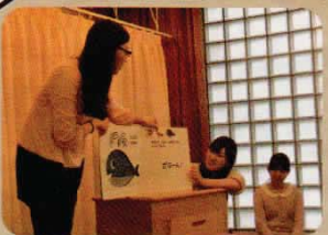
なぞその絵本、一緒に考えるのはとても楽しいね☆

月に1回、世田谷区立中央図書館で本の読み聞かせを行っています。大学の講義で、読み聞かせや手遊びを習っている、子どもたちの前で実践する機会はありません。当日集まった子どもたちの年齢や人数に合わせて、工夫を凝らして活動しています。