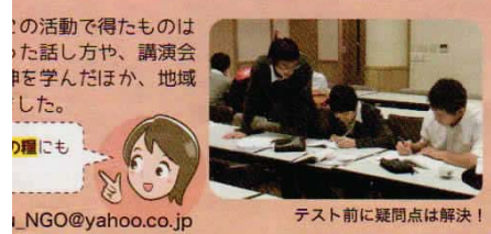
テスト前に疑問点は解決!

「ワカモノ」です☆ (※詳しくは調布謎倶楽部のHP「地域活動情報紙 第9号」は「若者の市民活動 10~20代の皆さんの活動現場にお邪魔しここに紹介しているのは、ほんの一部。それ様々な分野で活躍しているのですね! 未来を担う若者の皆さん、少しでも興味自分のため、地域のため、誰かのために