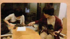
大好きな音楽のことなら、教える方も教わる方も真剣!