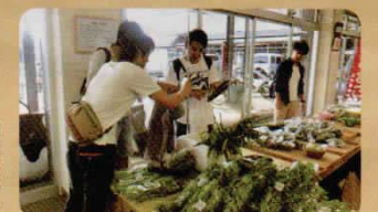
みんなでシナリオを考え中♪ (@「調布のやさい畑」)

調布の名所をPRしようと、学生目線で作成した動画を配信している大学生たちがいます。調布市に縁のある大学生が「調布を盛り上げよう!」と集まった、Withgrowのメンバー。市内のイベントに参加したり、学習支援を行ったりと、とにかくネットワークの軽い彼らの活動は、バラエティー豊かで、何より楽しそう! 動画撮影だってシナリオ等は一切なし! 「こうしたらいいんじゃない?」「この方が良くない?」と意見を出しながら和気あいあいと進めます。 彼らの動画を見れば、自分達が楽しむことが大切という活動の根幹が見えてくるはず!